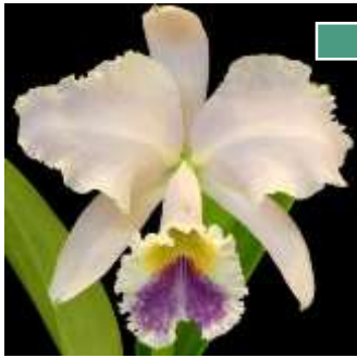
Cattleya labiata coerulea