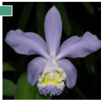
Cattleya loddigesi coerulea